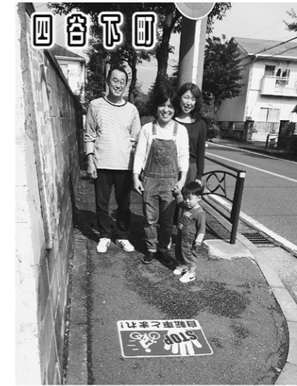
四谷下町 一時停止を促すステッカーを設置