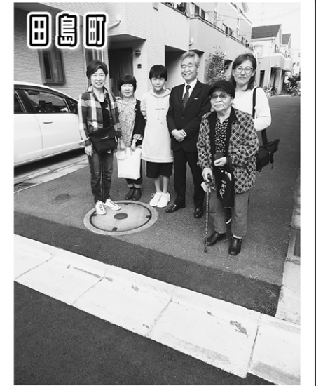
田島町 雨水対策として歩道と側溝を改修