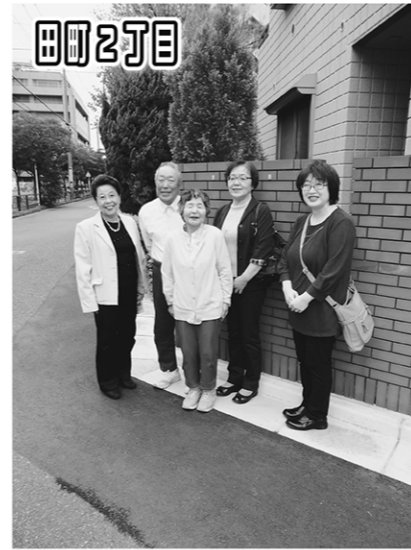
田町2丁目 雨水の流れにくかった側溝を改修