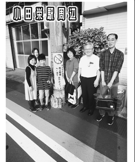
小田駅周辺 ポイ捨て禁止を促す表示を4カ所設置