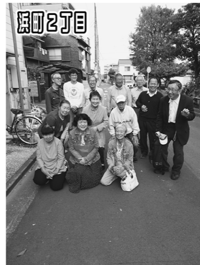
田町2丁目 デコボコのひどかった歩道を再舗装