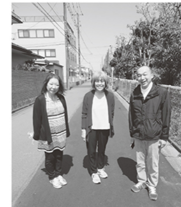
殿町2・3丁目 古くなっていた道路を再舗装