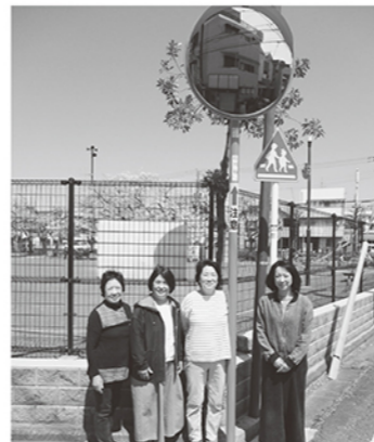
池上新町 交通安全のためカーブミラーを設置