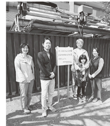
小田7丁目公園 マンション駐車場にボールが入らないよう注意看板を設置