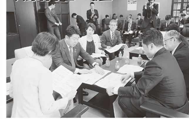
教育予算の増額と障がい児童・生徒のための特別支援学校の充実を求めて、市長とともに文部科学省へ要望活動を行いました。