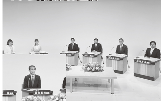
「予算の審議を前に」という市議会・座談会で、台風対策と中小企業への支援を強化する一年にしたいと決意を述べました。