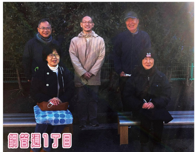
公園にベンチを2基設置